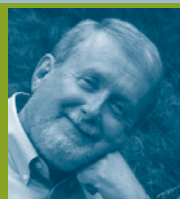
Participação especial de Jay Cross: Autor dos livros Informal Learning: Rediscovering the Natural Pathways that Inspire Innovation and Performance , Implementing eLearning e The Blended Learning Handbook